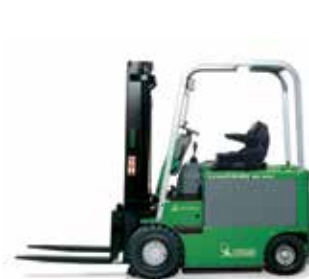
cenTAURO 80 250 - 300