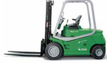
Mak 400 - 450 - 500