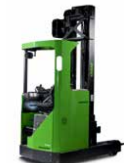
R212 - 214 - 216