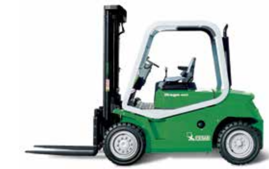
Drago 400 - 450 - 500