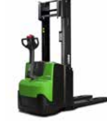
S212L - 214L