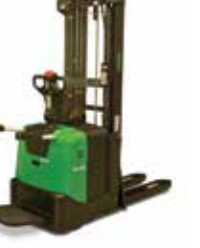
S313L - 316L - 320L