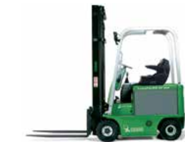
cenTAURO 48 160L - 200L