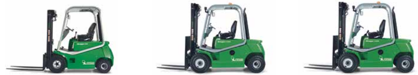
Drago 150 - 180 - 200